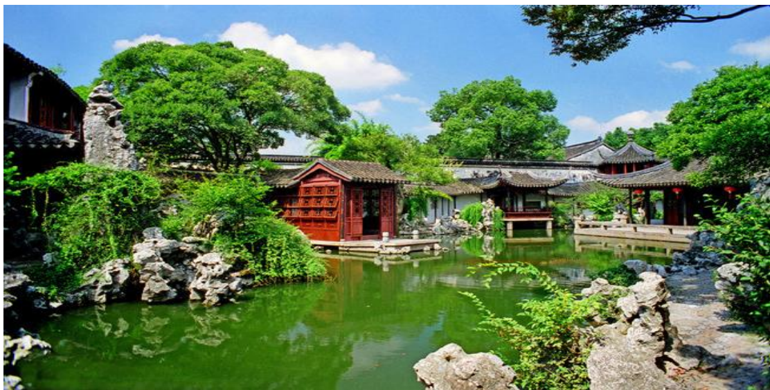
Tuisi-Garten in Tongli

Ihr Tag beginnt mit einem Spaziergang entlang der berühmten Uferpromenade " Bund ". Bei einer Bootsfahrt auf dem Huangpu können Sie in aller Ruhe das prachtvolle Skyline-Panorama der Stadt genießen. Im Shanghaier "Business District" Pudong fahren Sie anschließend hinauf in die obere Kuppel des Oriental Pearl Towers . Auf 468 Metern Höhe erwarten Sie beeindruckende Ausblicke über die gesamte Stadt!