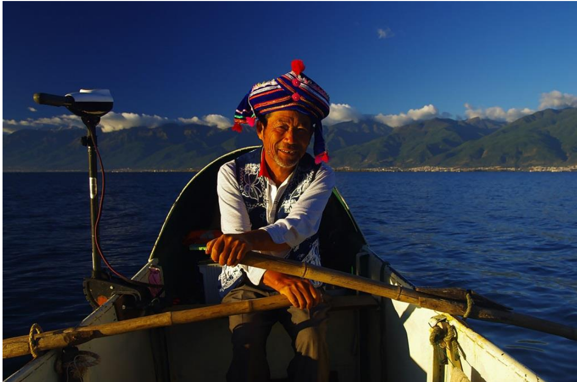
Bootsfahrt auf dem Erhai-See

Sie verlassen heute Kunming und machen sich auf den Weg nach Dali. Unterwegs besuchen Sie das Dorf Chuxiong , den Hauptort der Yi-Minorität. Angekommen in Dali, steht eine Bootsfahrt auf dem Erhai-See auf Ihrem Programm. Mitten auf dem See machen Sie Halt, um die so genannten " Kormoranfischer " bei ihren speziellen Fischfangmethoden zu beobachten.